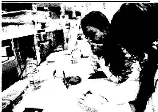
Primato Nel Lazio il maggior numero di eventi