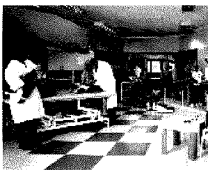
Tra i piccoli Presso l'Ospedale Bambino Gesù di Roma si potrà osservare la battaglia dei ricercatori contro le malattie